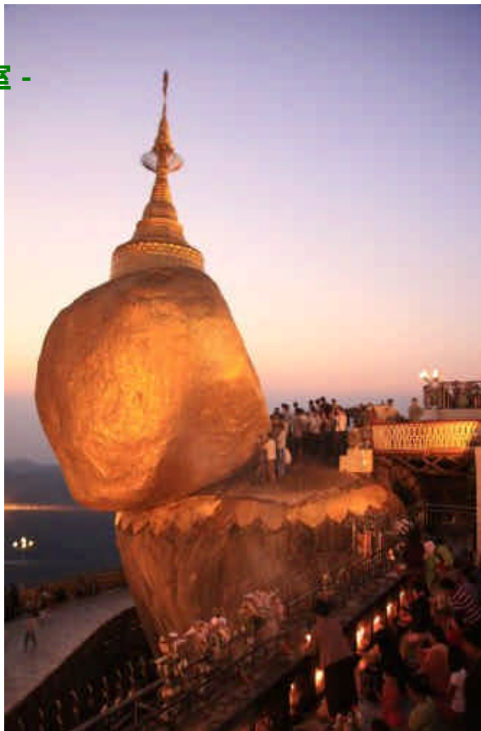
チャイティーヨー（ミャンマー）