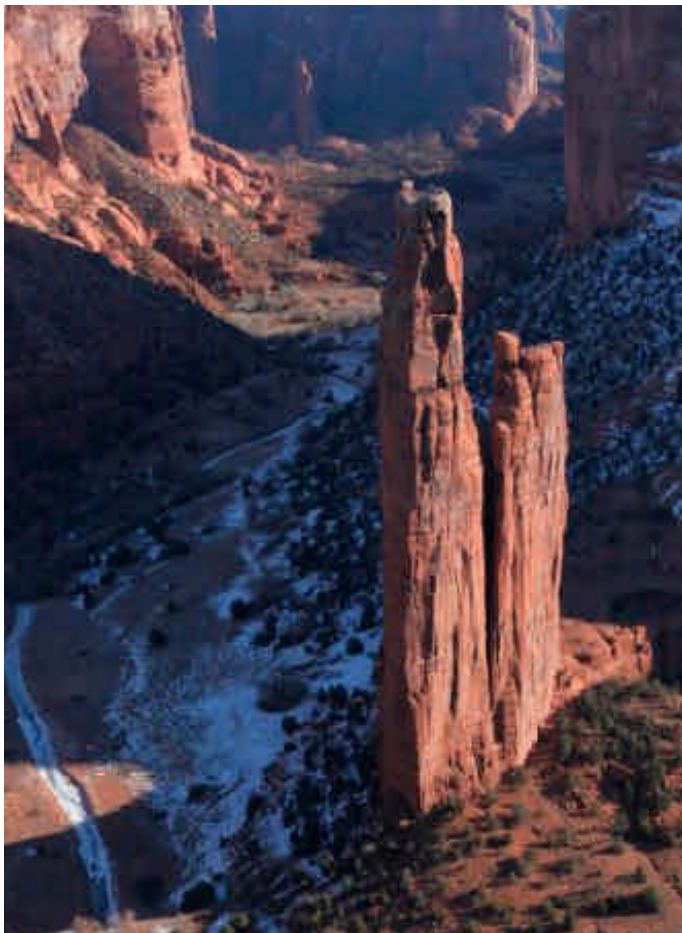
スパイダーロック（アメリカ）