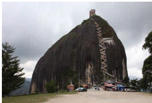
ピエドラ・デル・ペニョール（コロンビア）